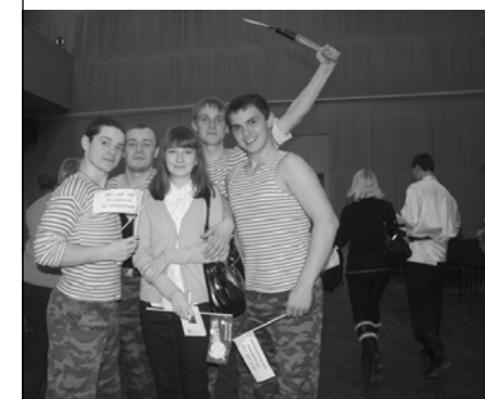
На областном фестивале «Мальчишник»