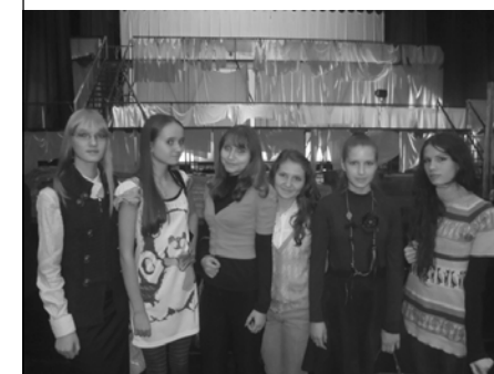
В любимом ТЮЗе