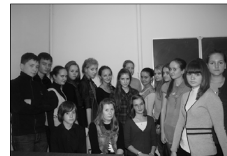
«Сюжет» — 2011