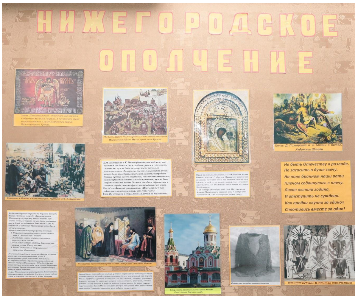
5-7. Выставка «Подвиг во имя России»