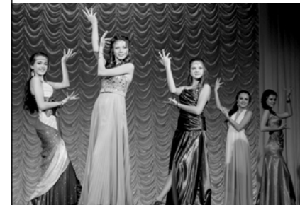
Студия моделей «Lady Kate»