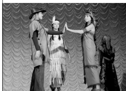
Театр моды «Колибри»