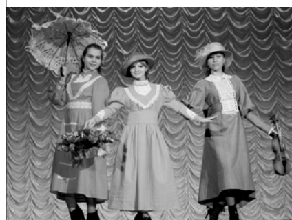
Детский театр моды «Зоренька»

Одной из проблем водных объектов является их повсеместное загрязнение бытовым мусором: пластиковые бутылки, целлофановые пакеты и тому подобное. Если мусор не убирать, то в скором времени реки и озера буквально им зарастут. Областной конкурс «Единые дни действий в защиту рек — 2013» и направлен на борьбу с мусором на реках и озерах области. Задача конкурса — не пустить мусор на берега и в воду, показать примеры грамотного обращения с твердыми бытовыми отходами.