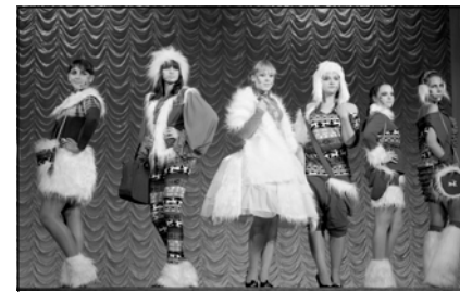
Театр моды «Стиль»

Нельзя не почувствовать прилив тепла и нежности, когда мимо пробегают очаровательные малышки в красивых костюмчиках и платьицах, перебирая маленькими ножками. Каждая из них наверняка представляет себя прекрасной принцессой и получает от этого огромное удовольствие. Не меньшую