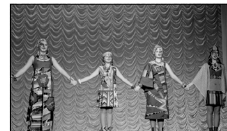
Театр моды «Золушка»

Под песенку «Чунга-Чанга» коллек- цию «Ритмы Африки» представил театр моды «Золушка» Балахны. Платья, голов- ные уборы, обувь и даже фейс-арт отсылали нас к жаркому континенту, маршрут пре- бывания на котором можно было тут же и выбрать: центральный костюм коллек- ции представлял собой карту. руководи-