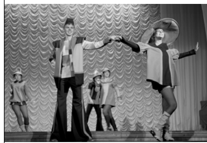
Детский театр моды «Русь»