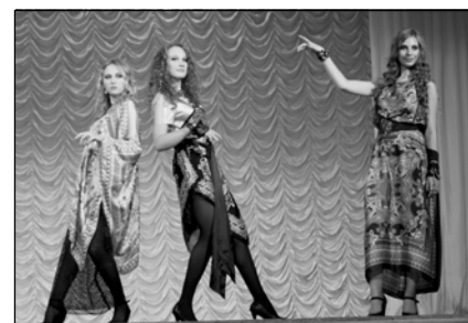
Студия моды и стиля «Индиго»

— Fazzoletto по-итальянски — это платок, поэтому мы и использовали