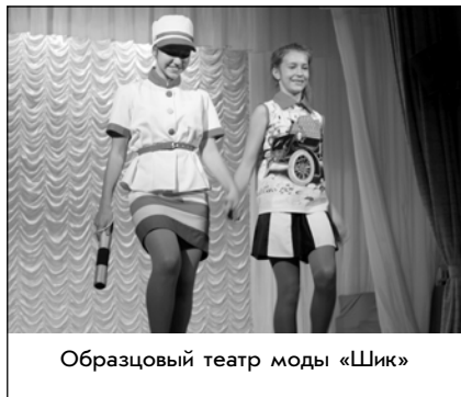
Образцовый театр моды «Шик»

Не менее динамичной и яркой была коллекция «Берегись автомобиля» образцового детского коллектива, театра моды «Шик» Центра развития творчества детей и юношества Нижнего Новгорода. Название коллекции, позитивное у одноименного фильма, и