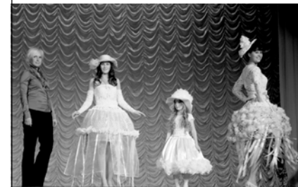
Образцовый театр моды «Златорусье»