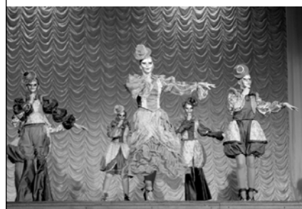
Образцовый театр моды «Прекрасная леди»