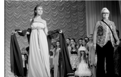
Театр моды «Жар-птица»