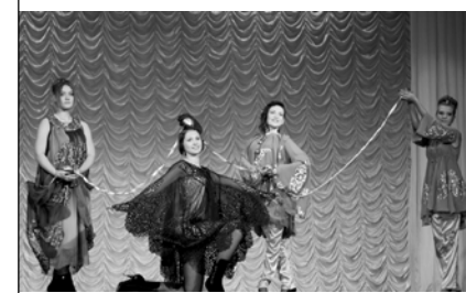
Театр моды «Кокетка»