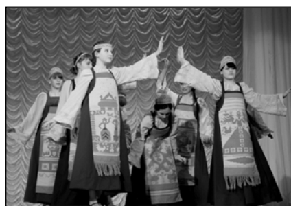
Театр современного народного костюма «Саквояж»

Ожидать звонка от прекрасного принца в удобных и практичных джинсовых и льняных платьях, жилетах и брюках клеш нам предлагает театр моды «Винтаж» нижегородского Детско-юно-