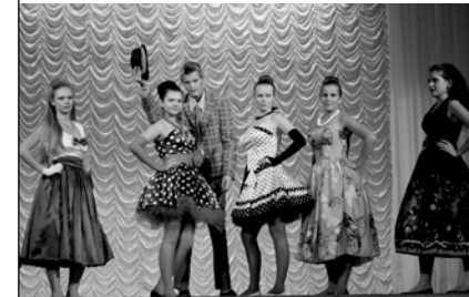
Театр моды «Лики молодости»